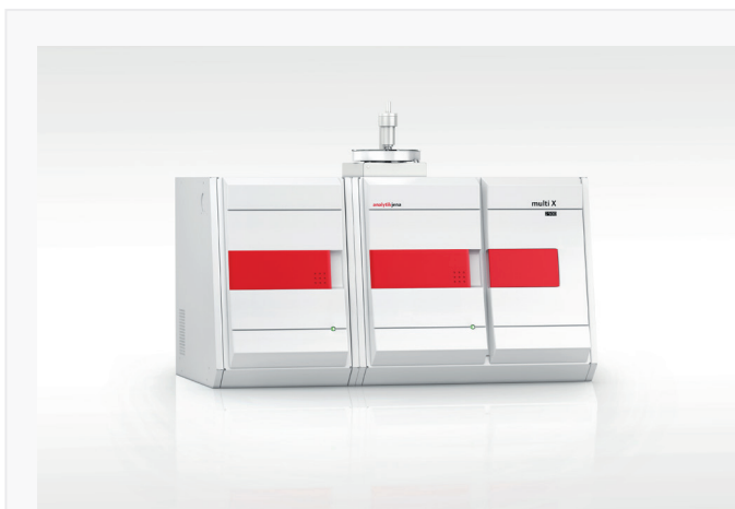
Abbildung 2: multi X 2500 vertikal mit autoX 36